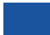
MC-Color Blue 730

Hinweis: Die hier abgebildeten Farben dienen nur zur Orientierung. Die Farbstärke im Beton hängt von vielen Einflussfaktoren wie unter anderem der Beschaffenheit der verwendeten Ausgangsstoffe und des Wassergehalts im Beton ab. Vor der Verwendung der Flüssigfarbe sind daher Ausgangsversuche durchzuführen, in denen die Farbe und die Dosierhöhe zu bestimmen sind.