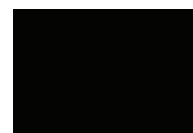
MC-Color Black 830