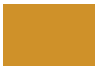
MC-Color Yellow 960