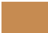
MC-Color Brown 610