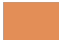
MC-Color Brown 639