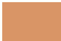
MC-Color Brown 639