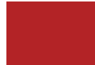
MC-Color Red 130