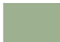
MC-Color Green 740