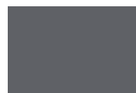
MC-Color Black 370