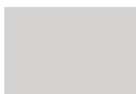
MC-Color Titaniumwhite 720