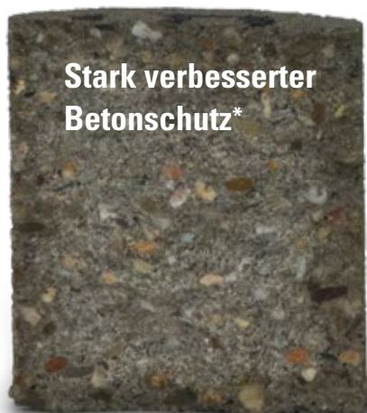
Stark verbesserter Betonschutz*