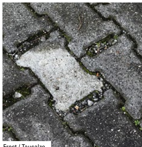
Frost / Tausalze

Die Produktreihe Murasan Hydrotech 883 bietet für jeden Hydrophobierungsgrad die passende Lösung – bis hin zur stärksten Hydrophobierung mit Lotuseffekt. Für einen maximalen, lang anhaltenden Schutz vor eindringender Feuchtigkeit.