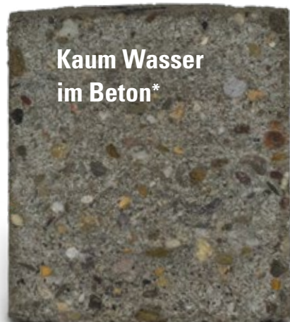
Kaum Wasser im Beton*