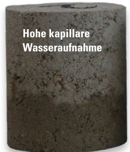
Hohe kapillare Wasseraufnahme