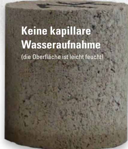
Keine kapillare Wasseraufnahme (die Oberfläche ist leicht feucht)