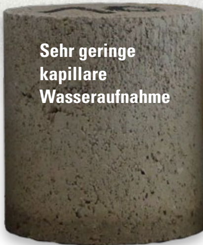
Sehr geringe kapillare Wasseraufnahme