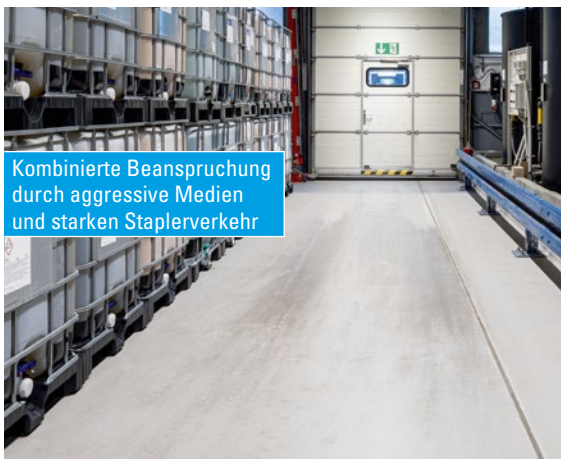
Kombinierte Beanspruchung durch aggressive Medien und starken Staplerverkehr

Die chemische Beständigkeit des Schutzsystems MC-DUR ChemProtect bei unterschiedlichsten Chemikalien sorgt für einen dauerhaften Schutz des Untergrundes – auch im Havariefall. MC-DUR ChemProtect bietet selbst bei erhöhten Anforderungen an die Rissüberbrückung dauerhaft Sicherheit – und das ohne zusätzliche elastische Zwischenschicht.